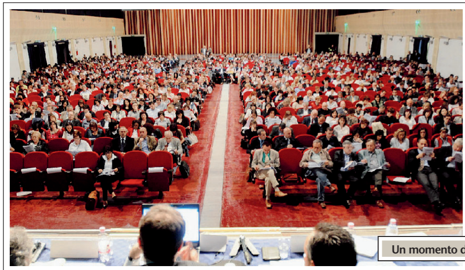
Un momento del convegno di ieri al Palabrescia