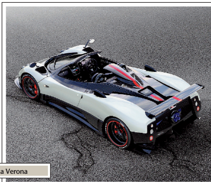
Riva e Pagani, due marchi di superlusso a Verona